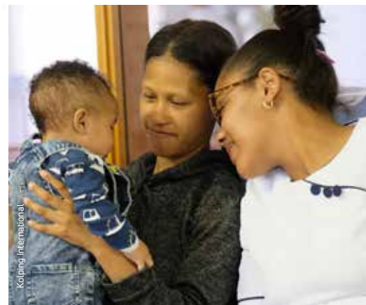
Hilfe für Mütter und Kinder: Projekt „Spark“ von Kolping Südafrika.