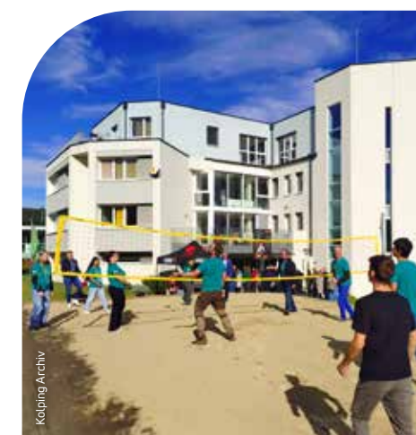
Nach 72 Stunden „kompromisslosen“ Einsatzes reichten die Kräfte noch für ein Spiel zur Einweihung des neuen Volleyballplatzes vor dem Kolpinghaus.

Der neue Volleyballplatz soll künftig den Bewohnerinnen und Bewohnern des Kolpinghauses, aber auch Sommergästen und anderen Interessierten aus Mistelbach und Umgebung als Sportmöglichkeit und Wohlfühlort dienen; somit wird die gemeinsame Arbeit noch lange reichlich Früchte tragen – im übertragenen wie auch im wörtlichen Sinne.