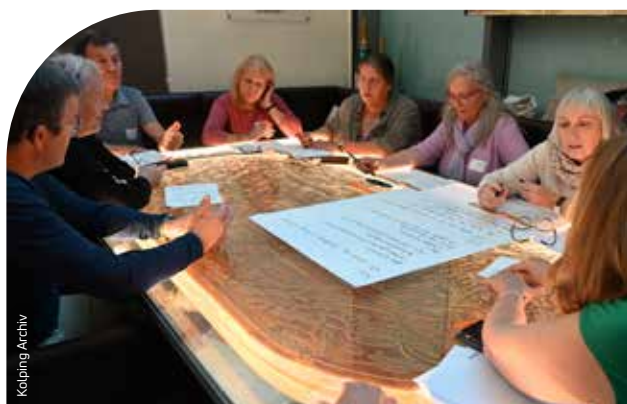
Delegierte aus allen Diözesanverbänden legten in Klagenfurt die Grundlinien fest, wie wir das 175-Jahr-Jubiläum unseres Verbandes in würdiger Weise feiern wollen.

Die Ergebnisse, kurz zusammengefasst: Der runde Geburtstag soll mit zahlreichen Aktivitäten und Festen, verteilt über das ganze Jahr und das gesamte Gebiet unseres Landes, begangen werden – als Kraftquelle für uns selbst und als Gelegenheit, im öffentlichen Raum in Erscheinung zu treten. Durch geeignete Formate sollen Menschen im Umfeld der Kolpingsfamilien angesprochen und auch die jüngere Generation erreicht werden. Ebenso geplant sind Fundraising-Maßnahmen zur Erfüllung von „175 Herzenswünschen“ und ein Update des „Kolping-Leitbilds“, das allen Mitgliedern, Mitarbeiterinnen und Mitarbeitern unseres Verbandes grundlegende Orientierung „auf der Höhe der Zeit“ vermitteln soll; auch dafür wurden im Rahmen des Kreativtags die inhaltlichen Weichen gelegt.