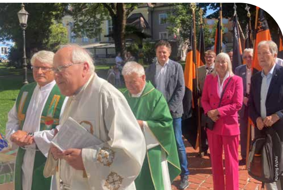
Erfolgsmodell: Rund 300 Kolpingleute kamen bei der Wallfahrt nach Bärnbach zusammen.