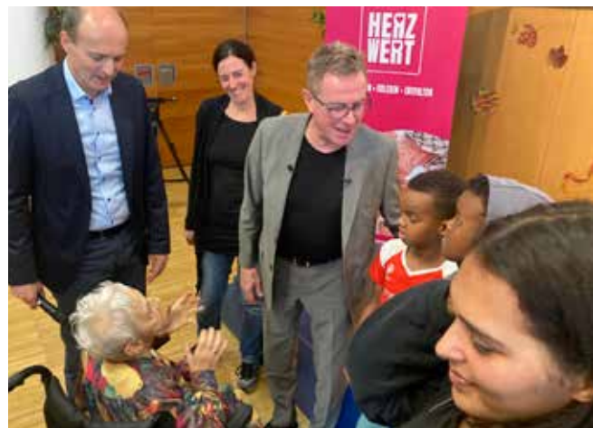
Was macht man mit einer Chance? – Man ergreift sie, denn sie könnte der Beginn einer wunderschönen Sache sein: Mit Lebensweisheiten wie diesen gewann ÖFB-Teamchef Ralf Rangnick die Herzen seiner bunt gemischten Zuhörerschaft.