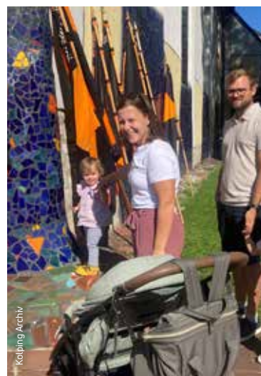
Faszinierend auch für Junge – die bunte Farbgebung der „Hundertwasser-Kirche“ in Bärnbach/Stmk.