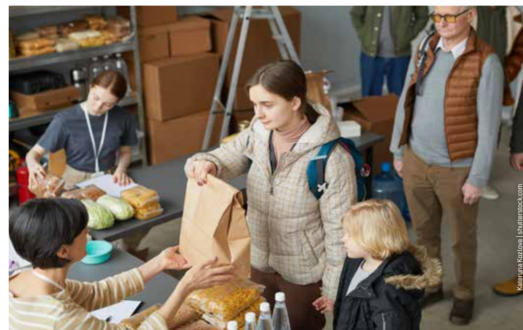
Frauen – vor allem solche mit einer Flucht-Biografie und wenig formaler Bildung – sind besonders häufig von Armut bedroht oder betroffen.

In den heutigen politischen Diskursen zu Leistungsmissbrauch werden häufig Bilder und Metaphern verwendet, die sich gut in den Köpfen festsetzen können, wie die „soziale Hängematte“ oder die zuletzt ins Spiel gebrachten „Totalverweigerer“: Ein angebliches „Heer von Missbrauchern“ wird als das zentrale Problem beschrieben, wobei von der Betrachtung der Lebenssituation einzelner Betroffener abgesehen wird. Damit wird die Diskussion der wirtschaftlichen und politischen Gründe von Armut und Arbeitslosigkeit