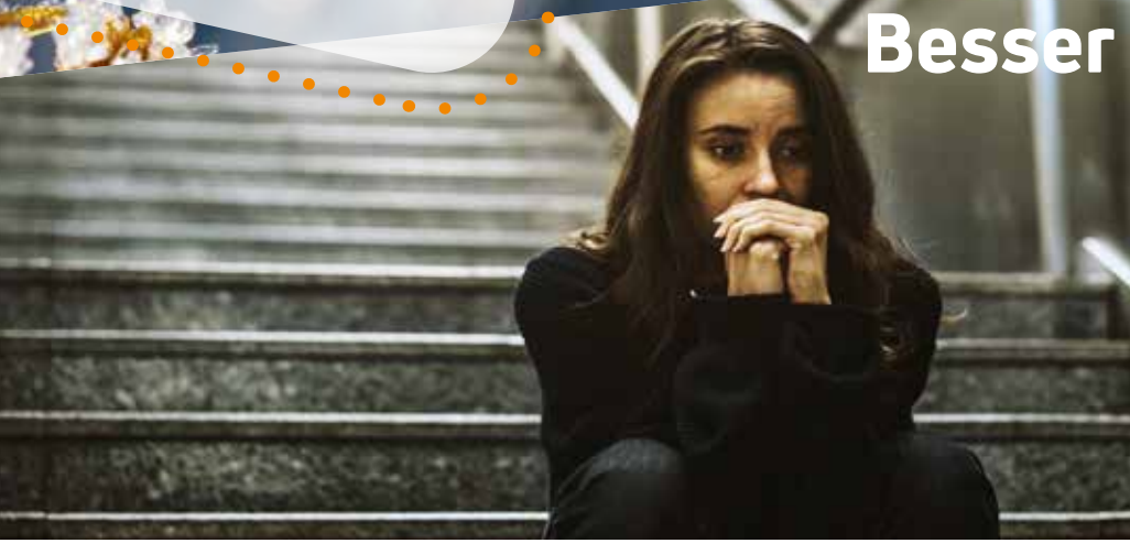
Hauptanliegen der Kolping-Strategie zum Gewaltschutz: wirksame Prävention und angemessene Reaktion im „Fall der Fälle“.

„Better safe than sorry“ – Besser ist es, für Sicherheit zu sorgen, als nachher bereuen zu müssen, nichts oder zu wenig getan zu haben: Mit diesem Satz lässt sich das umfassende Bemühen unseres Verbandes beschreiben, alle, die bei Kolping wohnen, arbeiten, betreut werden oder sich im Verein engagieren, vor Gewalt zu schützen sowie, sollten diese Schutzsysteme einmal versagen, die Betroffenen angemessen zu unterstützen.