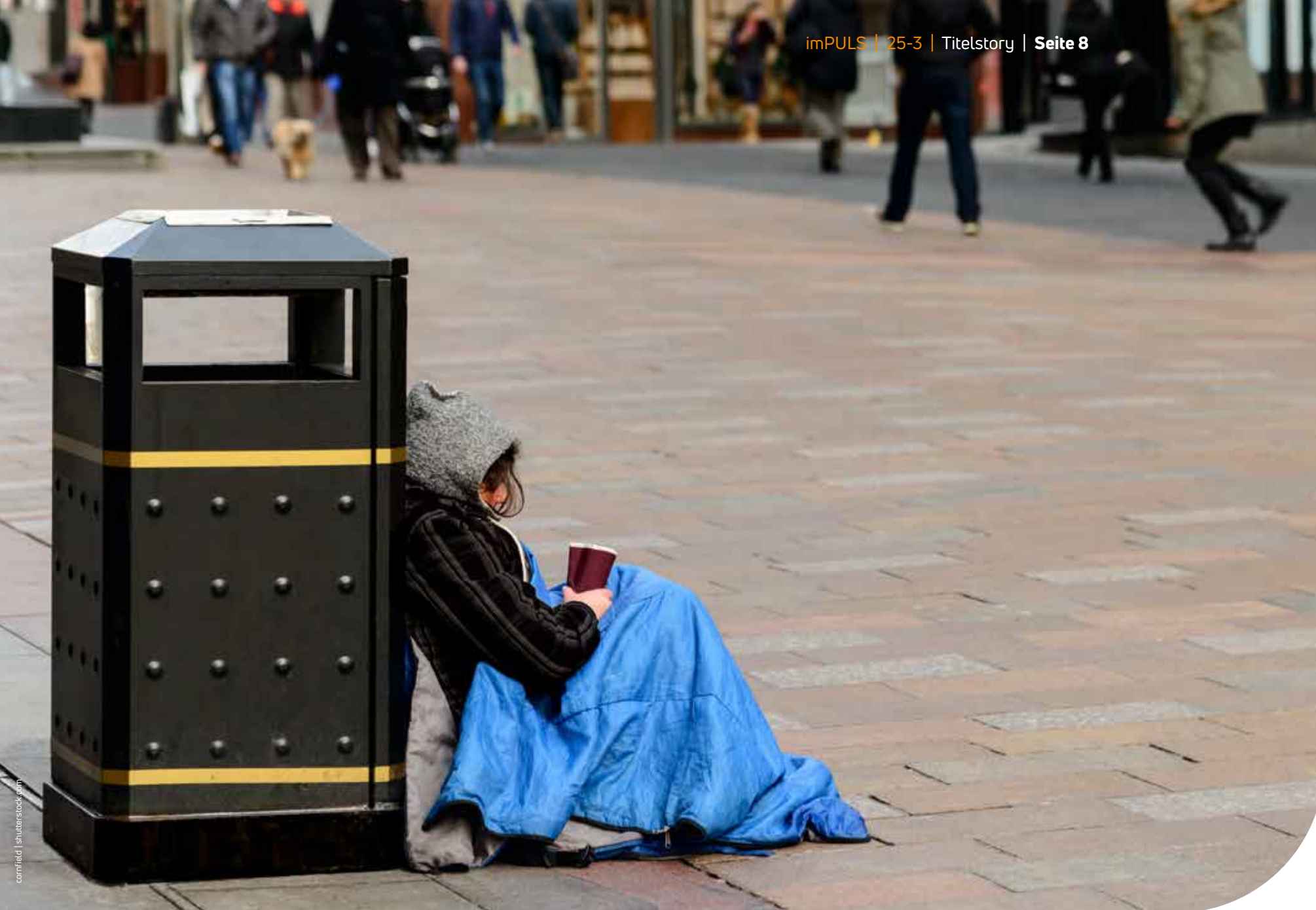
Wegschauen ist keine Lösung: Das veranschaulichen nicht nur Beispiele wie der „Barmherzige Samariter“ in der Bibel.

wie auch die der belastenden Lebensumstände der Betroffenen vermieden: Es ist gerade die Vagheit der Vorwürfe, die solche Diskurse funktionieren lässt.