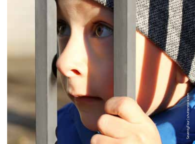
„Alle müssen den Gürtel enger schnallen“, heißt es; was aber, wenn es kein Loch mehr zum Engerschnallen mehr gibt?

Mit den Texten in dieser Ausgabe des „imPULS“ wollen wir einen Beitrag dazu leisten, dass Armutsbetroffenen wieder mit mehr Wertschätzung begegnet wird; dazu fühlen wir den Vorwürfen auf den Zahn, die gegen sie erhoben