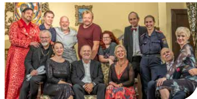
Laientheater vom Feinsten: Die Kolpingbühne Wien-Alsergrund ist zurück!

Theater gespielt wird neuerdings auch im Kolpinghaus Klagenfurt-Zentral, wo Kinder im Alter von 8 bis 12 Jahren in Schnupperkursen ihr schauspielerisches Talent entdecken und entfalten können. Und noch bis 21. Dezember ist auf der Kolpingbühne Hall/Tirol das Märchen „Der Meisterdieb“, frei nach den Gebrüder Grimm, zu sehen; Info und Kartenbestellung: info@kolpingbuehne.at Tel.: 0677/611 58929